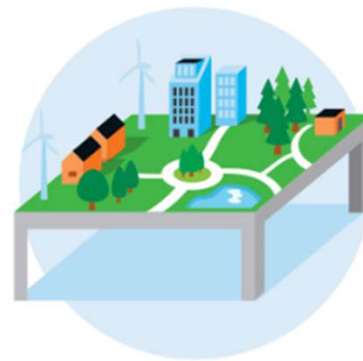
2 Leefomgeving centraal