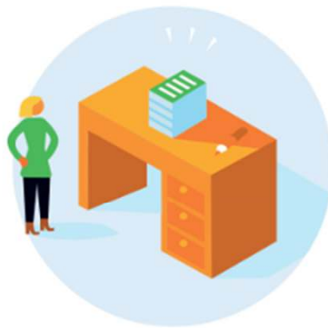
1 Inzichtelijk omgevingsrecht

Balans tussen gezonde en veilige fysieke leefomgeving en goede omgevingskwaliteit, en het in stand houden van de fysieke leefomgeving door doelmatig beheer, gebruik en ontwikkeling om de maatschappelijke behoefte te vervullen.