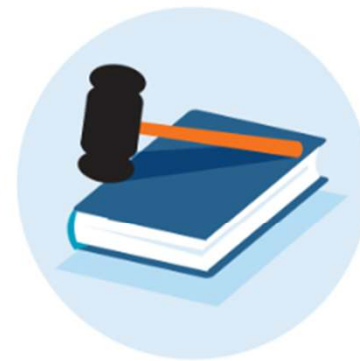
4 Sneller en beter